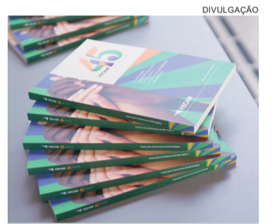
A publicação é resultado da parceria da FECAM com a agência Share, responsável pela concepção do projeto que integra as celebrações oficiais da entidade.

A publicação é considerada um marco que celebra as quatro décadas e meia de dedicação da FECAM à representação e ao desenvolvimento dos municípios catarinenses. A revista documenta a evolução do municipalismo no estado, destacando as conquistas, os desafios superados e o papel fundamental da Federação na capacitação de gestores e na articulação de políticas públi-