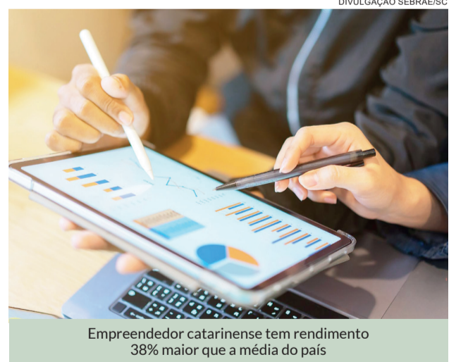
Empreendedor catarinense tem rendimento 38% maior que a média do país

Para o gerente de Gestão Estratégica do Se-