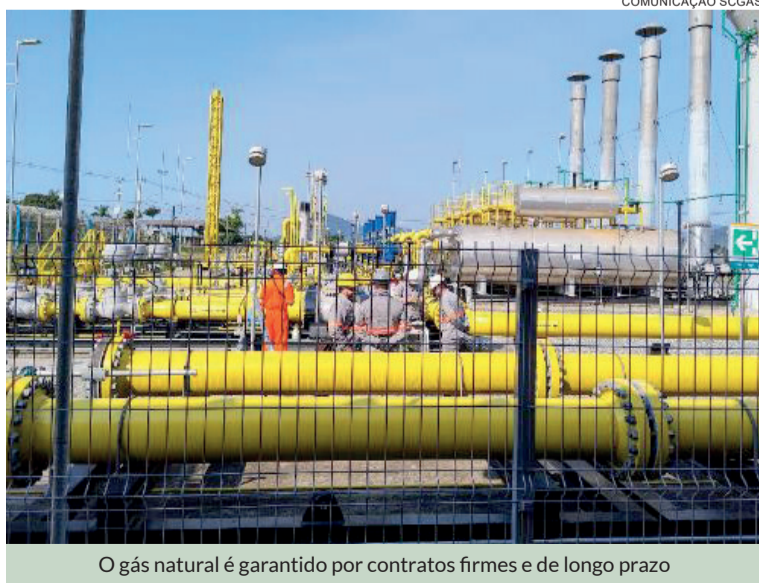
O gás natural é garantido por contratos firmes e de longo prazo