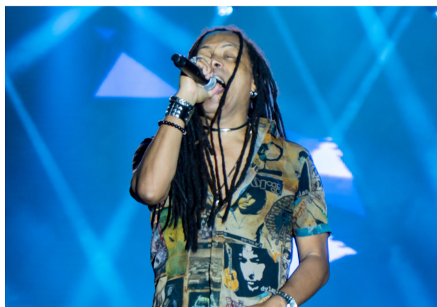
Papas da Língua