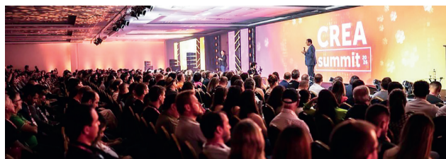
Crea Summit 2026 ampliou o debate sobre os desafios e caminhos para o desenvolvimento das cidades catarinenses.