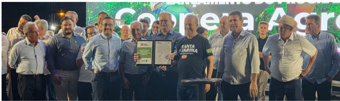
Assinatura do Coopera Agro SC, junto com cooperativistas CooCam, Copercampos e Indústria: Seara Alimentos e JBS Indústria de Alimentos.

Pecuária (Sape) e operacionalizado pelo Banco Regional de Desenvolvimento do Extremo Sul (BRDE), a construção teve participação efetiva da Secretaria de Estado da Fazenda (SEF) e Secretaria de Estado do Planejamento (Seplan). O objetivo é ampliar a competitividade do campo, destravar investimentos e promover desenvolvimento sustentável em todas as regiões catarinenses.